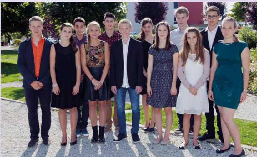
Riaz, samedi 20 septembre 2014.