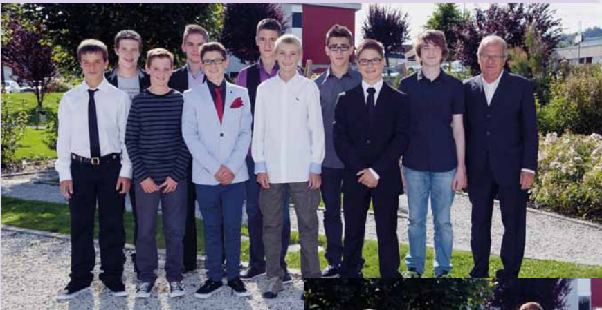
Riaz, samedi 20 septembre 2014.