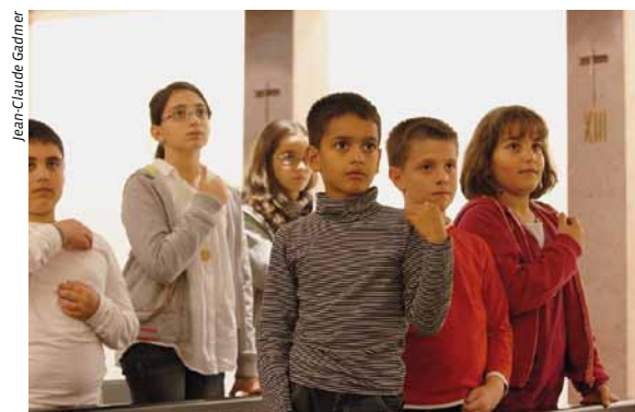
Un engagement des enfants.

La participation active des enfants et familles est mise en œuvre lors du rite pénitentiel, des lectures, des intentions de la prière universelle, de l'apport des offrandes, lors de l'action