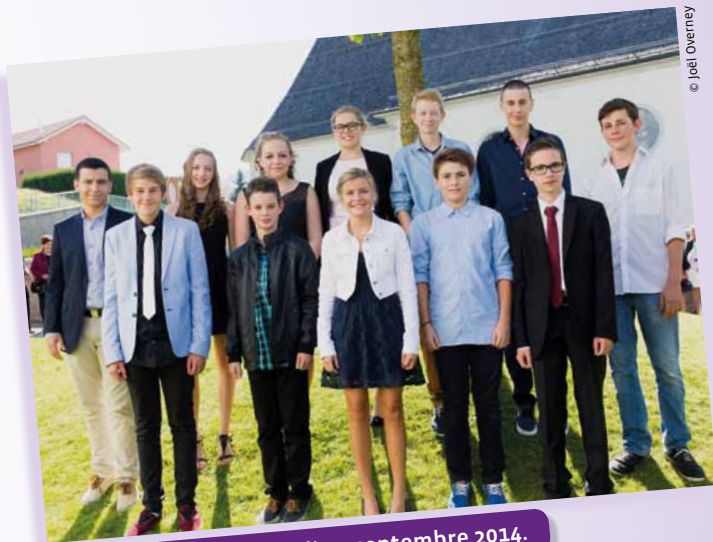
Vuadens, samedi 20 septembre 2014.