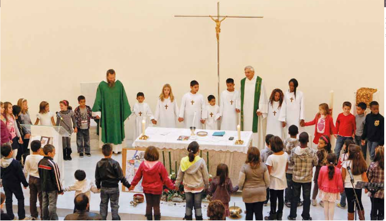
Un temps dédié aux enfants à l'église de la Sainte-Trinité à Genève.

blées d'enfants améliorent le langage, mais le rythme n'est guère différent. Le Notre Père remet l'assemblée en mouvement et l'échange du signe de paix peut être l'occasion d'un pieux brouhaha.