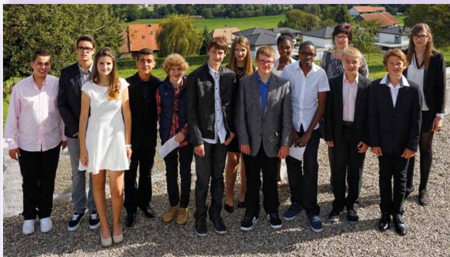
Sorens, samedi 20 septembre 2014.