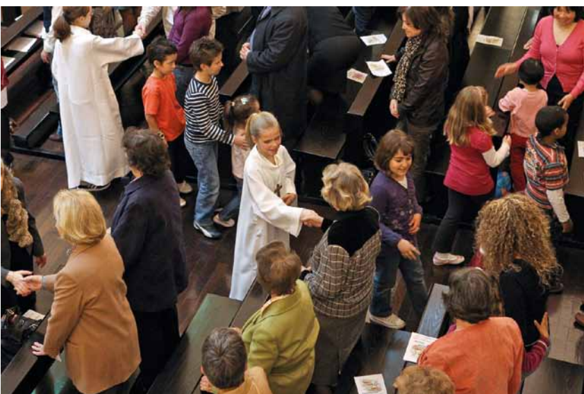
Un partage intergénérationnel.