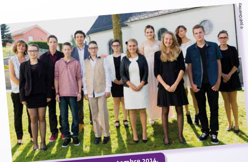
Vuadens, samedi 20 septembre 2014.