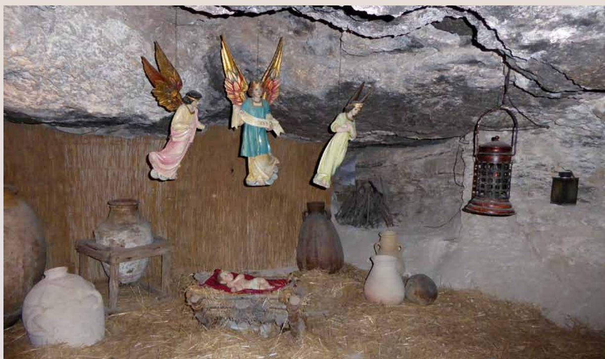
Champ et grotte des Bergers, Beit Sahour.