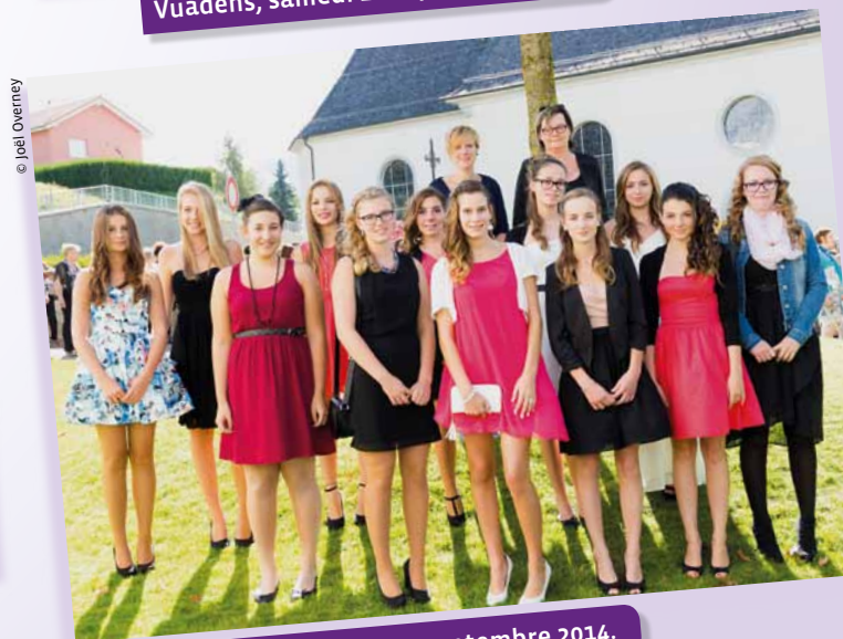
Vuadens, samedi 20 septembre 2014.