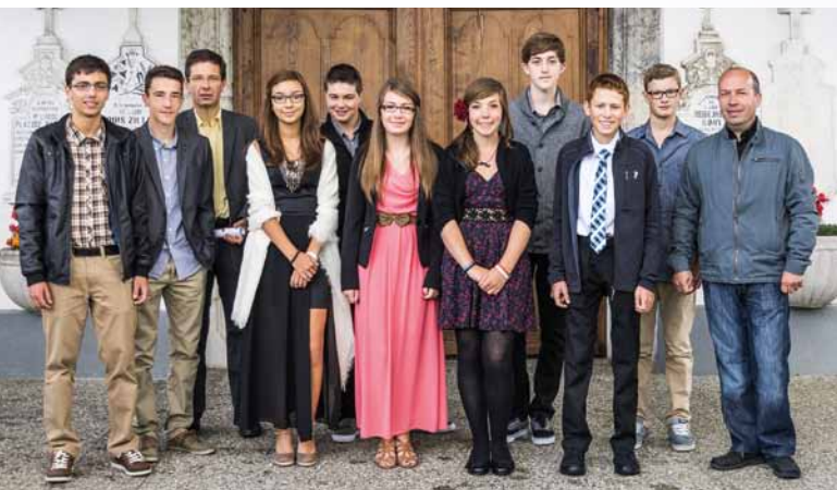
Sorens, samedi 20 septembre 2014.