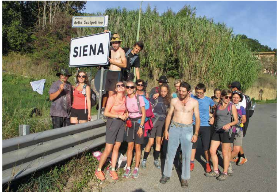
L'arrivée à Sienne.