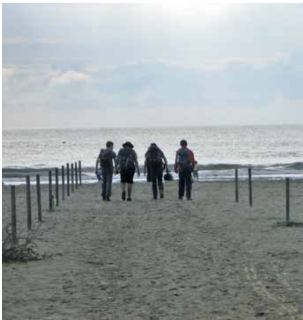
L'arrivée à la mer.

Debout les Pèlerins du Seigneur! C'est sur cet hymne composé par Victor Grandjean que 22 pèlerins entre 14 et 25 ans ont traversé la Toscane durant neuf jours ensoleillés. L'occasion de vivre au rythme des béatitudes commentées par le pape François dans son exhortation apostolique Gaudete et exsultate . Une expérience de partage et de fraternité qui se renouvelle chaque année depuis 2014.