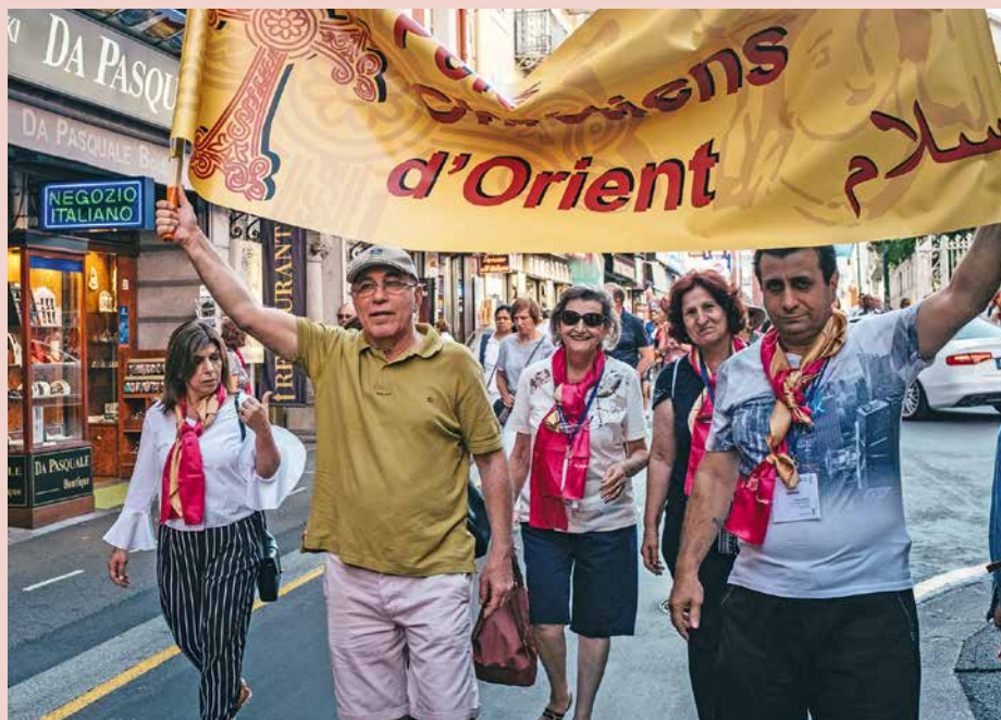
La pluriculturalité est à l'image de l'Eglise universelle.

Par l'actualité proche-orientale, on connaît désormais les Chaldéens, les Assyriens ou les Coptes. Médias et littérature ont prédit leur mort puis leur résurrection... Partagés entre terres d'origine et diasporas, ils se sont aussi installés dans le paysage romand, discrètement. Enquête.