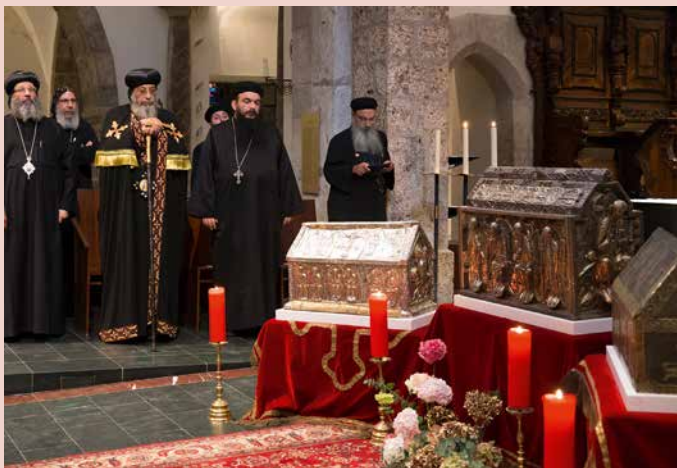
Exemple du lien entre chrétiens d'Orient et d'Occident, la visite du pape copte Tawadros II en 2014 à Saint-Maurice. Les Coptes sont présents notamment à Bienne, Genève et en Suisse allemande.

tés, la réponse fuse: «Trop de politique, pas assez de Dieu!» On n'en apprendra pas plus d'elle. Son choix est clair et ses enfants l'accompagnent dans la liturgie en rite romain, bien sobre pour une Ethiopienne – «et courte, car à Addis, explique-t-elle, la qedassié (messe) dure 6 heures»!