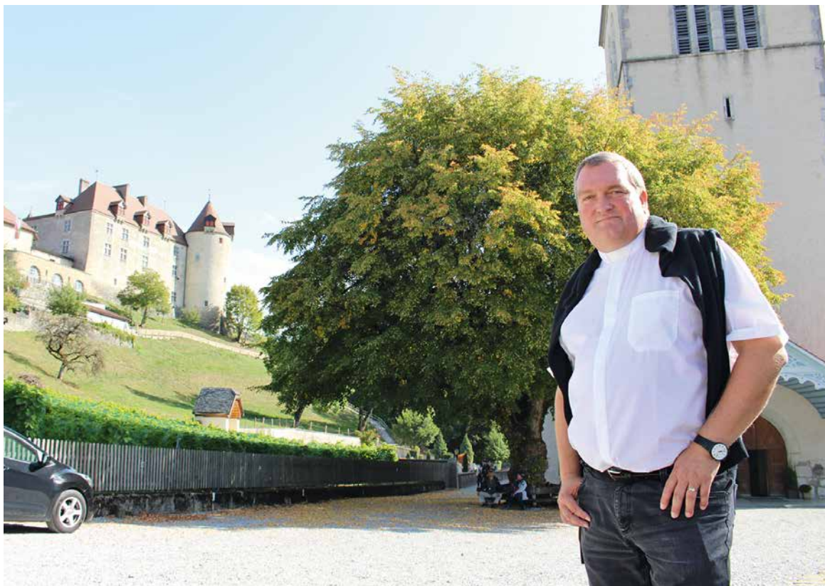
Le curé modérateur s'est très vite intégré en Gruyère.

Une bonne partie de ses après-midis et soirées consiste à discuter avec les familles pour préparer un baptême, des funérailles ou des futurs mariés: « Je ne peux pas donner un sacrement sans connaître les personnes concernées. S'il faut rester debout jusqu'à 2h du matin pour préparer un enterrement, je le fais. » Si, comme il l'avoue lui-même, il n'a pas une soirée de libre dans l'année, cela ne lui pèse pas: « Je rencontre les gens, je mange avec eux, ils deviennent des amis. Du ministère, mais des beaux moments. » Ses visites aux pensionnaires des EMS constituent sa plage de ressourcement: « J'adore les personnes âgées, qui sont souvent très touchantes. Les voir, c'est mon bol d'air! »