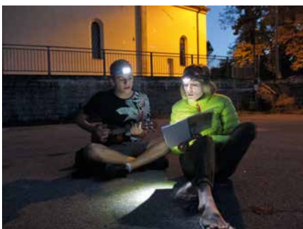
Chanter, c'est prier deux fois.

Debout les pèlerins du Seigneur, il faut vous réveiller La terre nous attend, Il nous faudra marcher