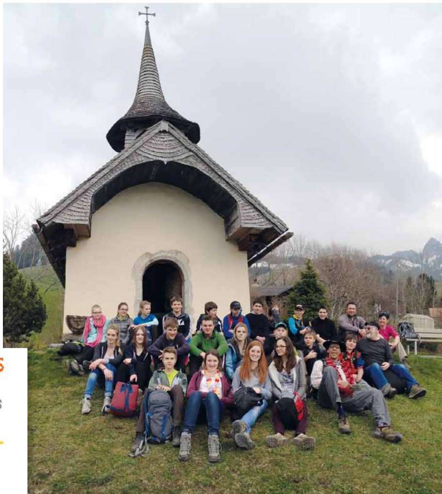
Pèlerinage de chapelle en chapelle.

Une vingtaine de jeunes ont répondu à l'invitation de l'aumônerie à venir vivre une messe dont le thème était le passage de la nuit du tombeau à la lumière de la Résurrection. C'est