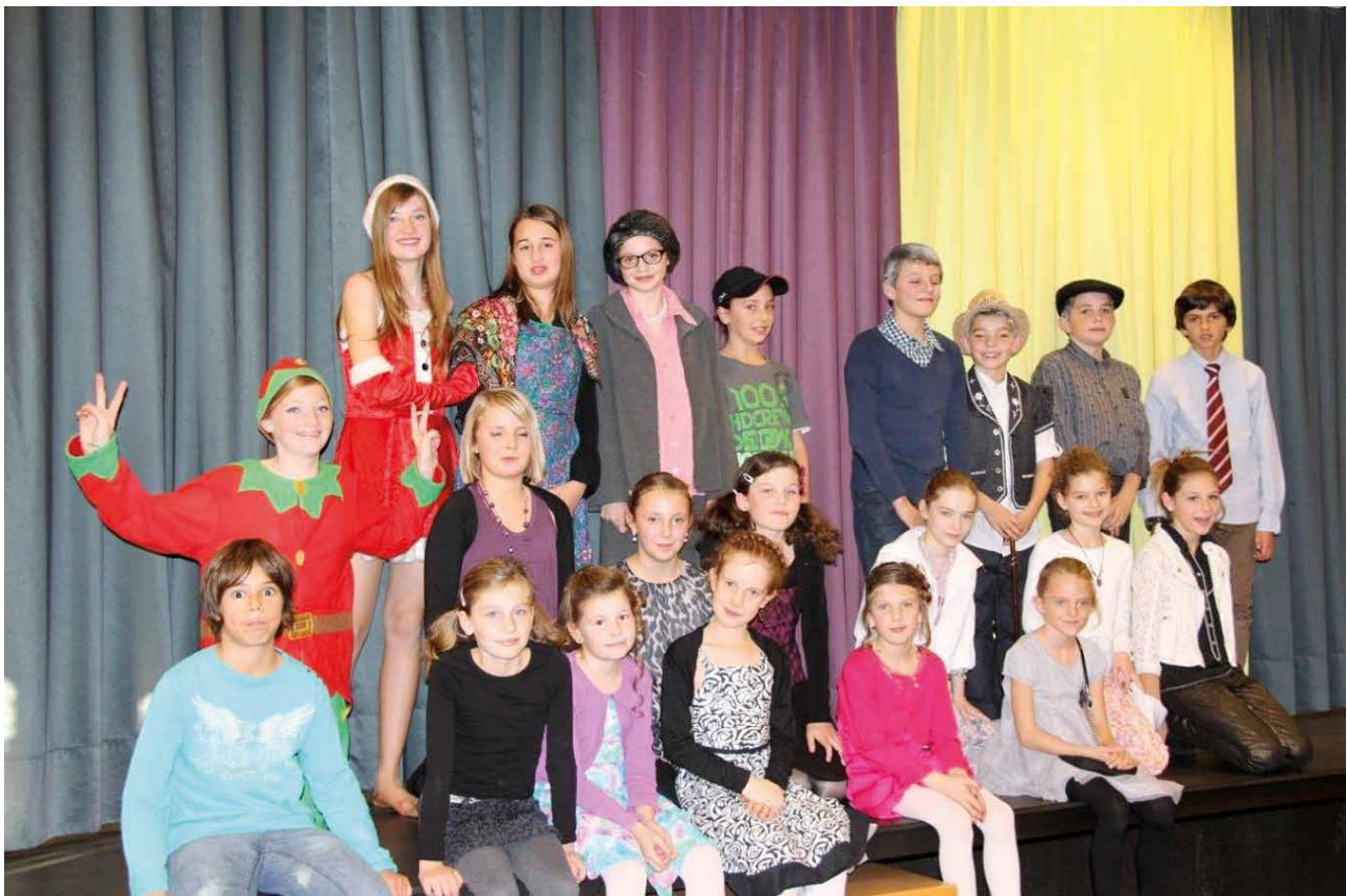
La troupe du spectacle « Vive la mariée ».