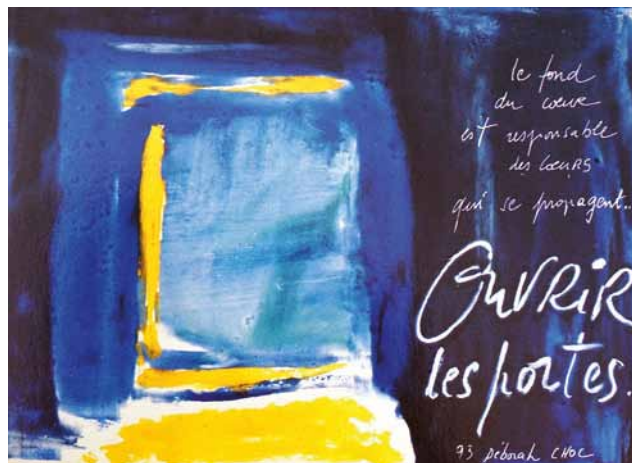
Ouvrir les portes pour... mieux SORTIR! (Œuvre de Deborah Choc).

Avez-vous déjà essayé d'avoir chaud sous une couverture trop petite? Il y a toujours un bout de pied qui n'est pas protégé. Il m'arrive de penser que nous nous comportons dans l'Eglise comme avec une couverture qui a rétréci au lavage. Oui, il y a moins de prêtres. Oui, la superficie à couvrir est de plus en plus grande. Mais tirer la couverture à soi ne va rien changer. Cela ne peut qu'engendrer des mécontentements et des frustrations.