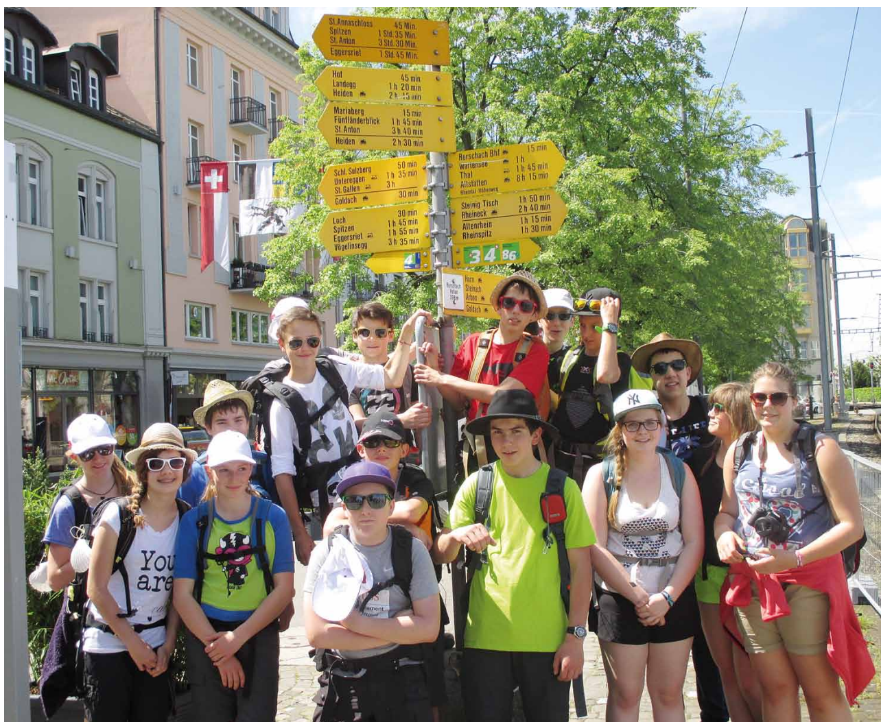
Départ de Rorschach.