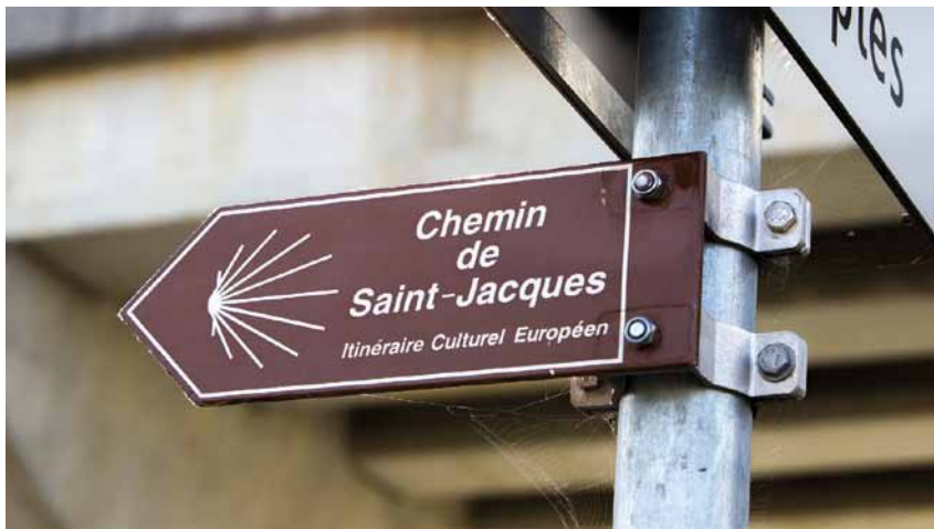
Les itinéraires spirituels sont de mieux en mieux balisés.

dernier, d'une statue de Jean-Paul II ce printemps, nombreuses affaires ici et là entre l'Etat et des particuliers – l'Eglise étant un particulier comme un autre au pays de sa fille aînée. On y dégage facilement les lois laïques, dont celle de 1905. Pourtant, la place de l'Hôtel-de-Ville à Paris a eu longtemps sa crèche, et on processionna chaque