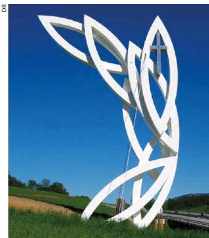
Au bord de la Transjurane, un épi artistique surmonté d'une croix discrète.