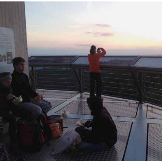
Sentinelles dans la nuit.

Du 31 mai au 3 juin, cinq jeunes ont vécu un camp «à l'envers»: marche nocturne et sommeil diurne leur ont permis de découvrir des «Sentinelles dans la nuit».