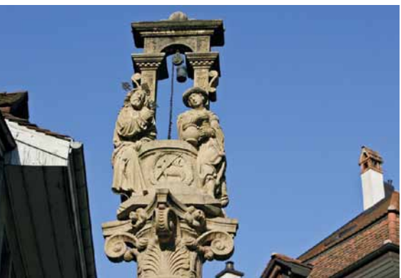
La fontaine de La Samaritaine en vieille ville de Fribourg.

Au pays des libertés, la laïcité élevée au rang de religion d'Etat n'en finit pas de provoquer, au sujet de l'espace public et républicain, des incidents qui prêteraient à sourire s'ils ne donnaient à pleurer: retrait de crèches l'hiver