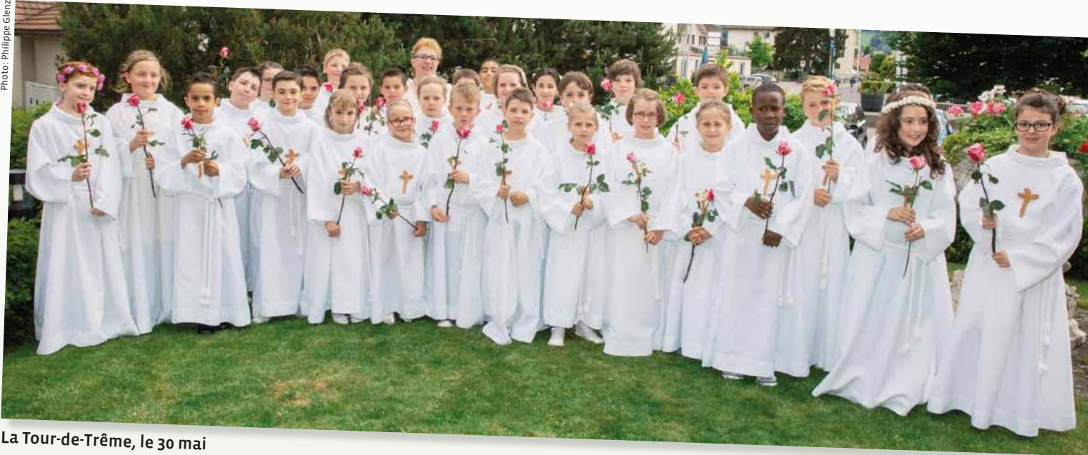
La Tour-de-Trême, le 30 mai