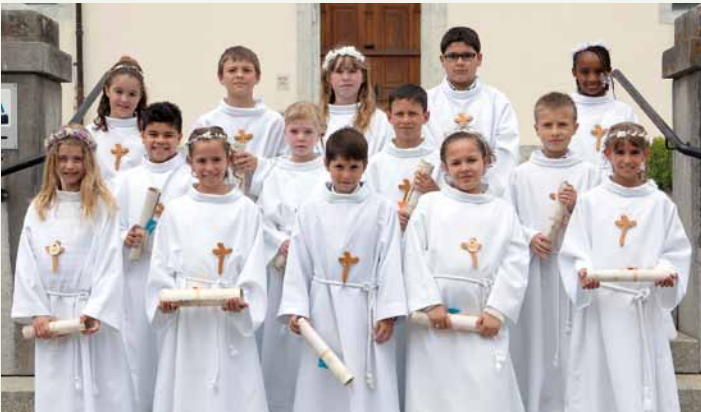
Bulle, le 30 mai