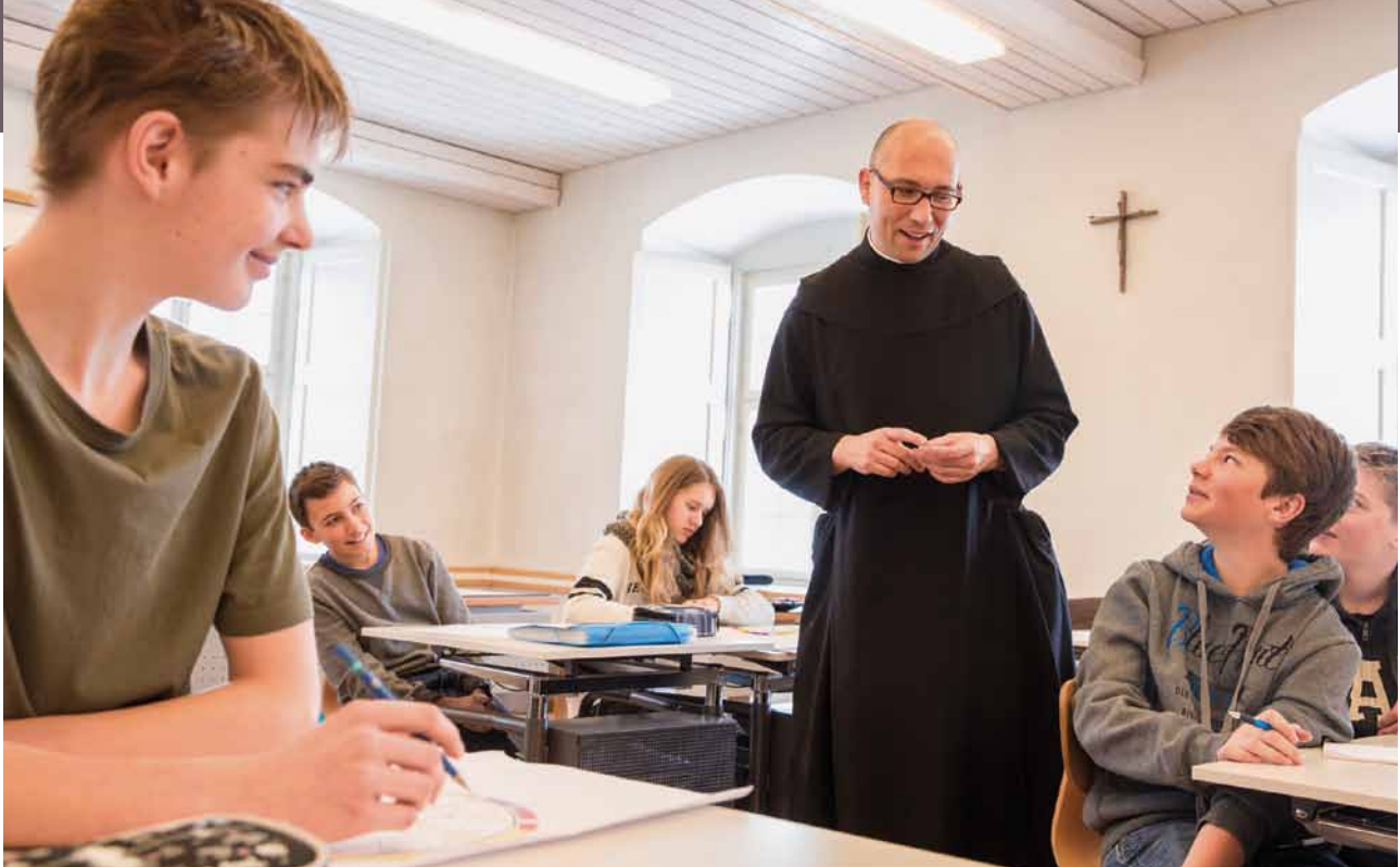
Des religieux enseignants : une réalité de plus en plus rare.

sont l'abréviation du latin Christus mansionem benedicat , à savoir: «Que le Christ bénisse cette maison.»