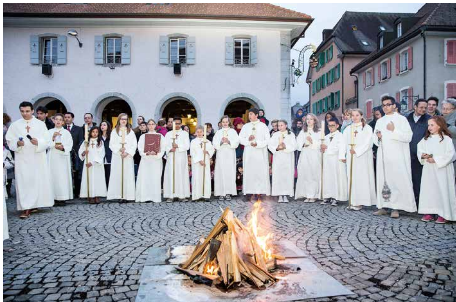
Veillée pascale 2014.