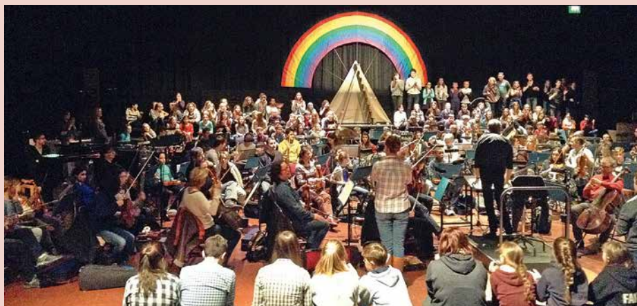
Ici joué en Grande-Bretagne, le spectacle « L'Arche de Noé » n'a pas pu être présenté en 2015 à Genève. Il l'a finalement été en novembre 2017.