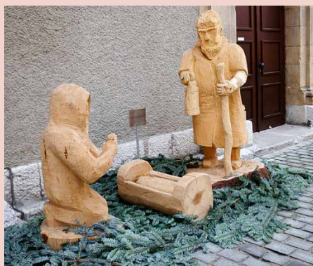
A Neuchâtel en 2015, la crèche posée sous le sapin de la ville a dû être déplacée.

A Neuchâtel, – qui se dit aussi ouvertement laïque –, une controverse est née à Noël 2015 après une décision de la Municipalité de retirer la crèche placée sous le sapin de la ville. « Il y a eu maintes réactions de chrétiens, mais le dialogue est resté positif. La Municipalité a proposé de déplacer la crèche », se rappelle le vicaire épiscopal neuchâtelois Pietro Guerini.