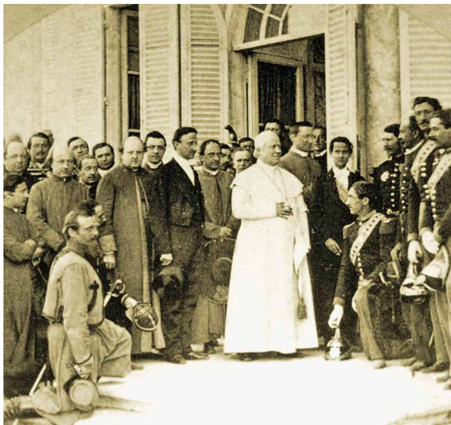
Pie IX, prisonnier du Vatican, a publié le «Syllabus» des erreurs de son temps. Cent ans plus tard, un Concile puis des papes affirmeront le contraire sur plusieurs points... «sic transit gloria mundi!»

Mais avec un risque: au nom des droits humains, des formes modernes de colonisations idéologiques se voient instaurées, celles des plus forts et des plus riches sur les plus faibles et les plus pauvres. François, par background , formation et parce que jésuite sud-américain, ne pouvait éviter de le répéter dans chaque pays visité aux périphéries du monde: Turquie, Albanie, Corée, Sri-Lanka... Fondamentalisme et laïcisme (y) sont les deux expressions erronées qui trahissent la liberté religieuse comme droit à l'égalité dans le respect de la diversité. «Ma liberté s'arrête où commence la tienne», reprendrait-il certainement, mais en y ajoutant «et ensemble, comme dans un polyèdre, tenons-nous la main pour agir mieux et plus... librement!»