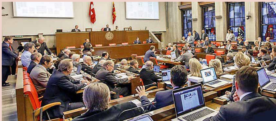
Le Grand Conseil genevois s'est prononcé sur une loi sur la laïcité, qui a généré des référendums.