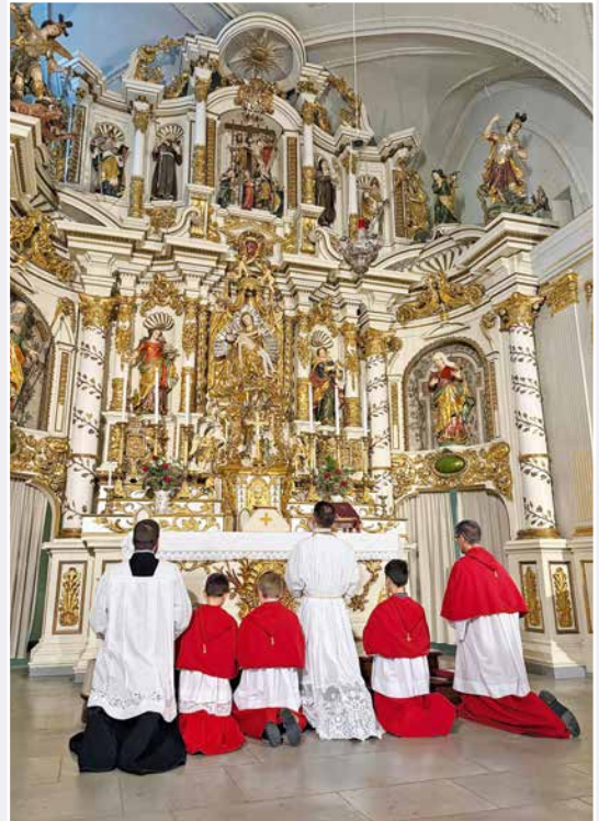
Action de grâces après la messe avec les servants

La Fraternité a été fondée le 18 juillet 1988 à l'abbaye d'Hauterive. Peu de temps après sa fondation et grâce à l'aide du cardinal Joseph Ratzinger (futur pape Benoît XVI), elle a été accueillie dans le diocèse d'Augsbourg, en Bavière, dans le sanctuaire marial de Wigratzbad. C'est là que se trouve aujourd'hui