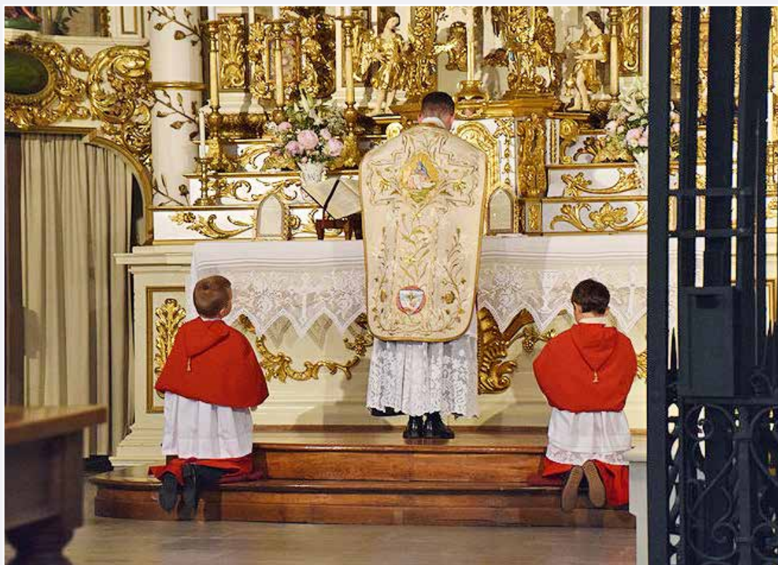
Célébration de la messe traditionnelle à la Chapelle Notre-Dame de Compassion

Que Dieu tout-puissant, par l'intercession de Notre-Dame de Compassion, vous bénisse et vous garde!