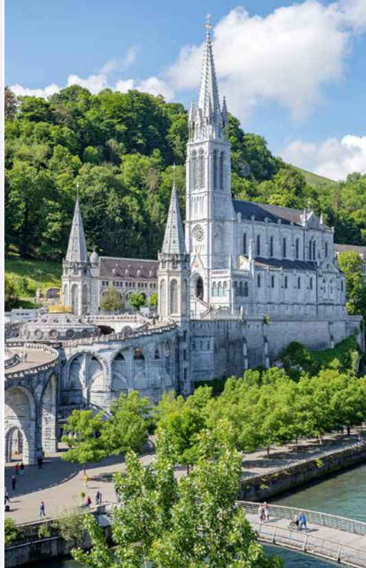
Vue de la basilique

Nous avions une à deux célébrations par jour avec des chants judicieusement choisis. Les plus touchantes pour moi ont été le sacrement de réconciliation à l'église Sainte-Bernadette et la célébration de l'onction des malades à la Basilique souterraine Saint-Pie-X. Il se dégage une ferveur intense dans la prière, entremêlant une assemblée participative dans le chant ou dans le geste et des silences apaisants. Nous donnons une sérénade pour les malades. Quelques pièces profanes se mêlent aux oiseaux, puisque nous sommes dehors. Le dernier chant est dirigé de main de maître par un malade qui en a tellement envie. Emmanuel Pittet lui passe alors volontiers la main. Voilà une fois de plus un instant de vive émotion, un grand merci à notre chef pour sa discrétion et son habileté. Qu'il est impressionnant de voir toute cette foule portée par le même amour pour notre bienheureuse Vierge Marie. Il transparait