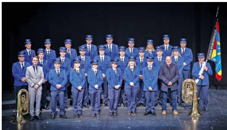
Fanfare L'Union Paroissiale

bration et la soirée qui a suivie à la salle de La Lisière à Sâles resteront sans aucun doute un souvenir marquant dans la vie villageoise et dans le cœur des membres des deux sociétés en fête.