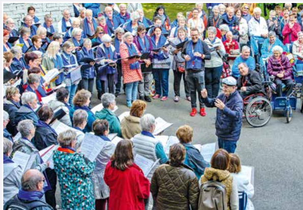
Aubade pour les malades. L'un d'eux a spontanément demandé de diriger le chœur

Ma semaine est déjà passée. Moi qui suis venue avec plein de clichés et d'a priori en tête, me voilà bien attrapée. En fait, comme je n'ai pas pu tout visiter, je serai bien obligée d'y revenir l'année prochaine ! »