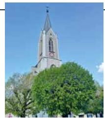
Le clocher de l'église Saint-Joseph de La Tour-de-Trême