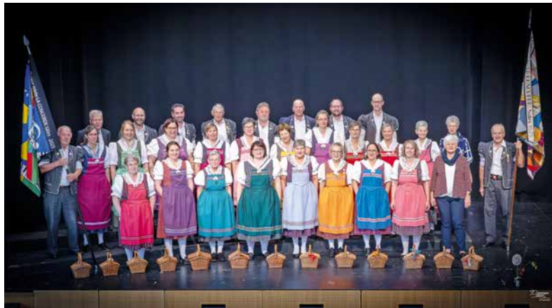
Chœur mixte La Concorde

Malgré le ciel pluvieux, la joie, la bonne humeur et les couleurs