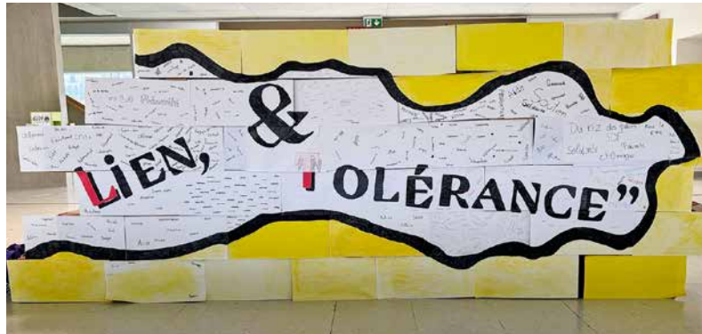
Fresque réalisée par les élèves

Les jeunes ont également découvert le travail de Caritas grâce à la présence du diacre Pascal Bregnard, directeur de Caritas Fribourg. Un film, produit par l'association « La Tuile » et réalisé par deux cinéastes fribourgeois, Sam et Fred Guillaume, leur a aussi permis d'aborder la thématique de l'exclusion sociale.